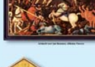
Paolo Uccello 1397-1475. Uccello war ein wichtiger Vertreter des Barock in der Malerei. Er war ein wichtiger Vertreter des Barock in der Malerei.