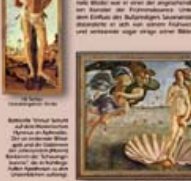
Sandro Botticelli 1445-1510. Botticelli war ein wichtiger Vertreter des Barock in der Malerei. Er war ein wichtiger Vertreter des Barock in der Malerei.