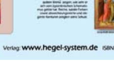
Duccio di Buoninsegna 1255-1318. Duccio di Buoninsegna war ein wichtiger Vertreter des Barock in der Malerei. Er war ein wichtiger Vertreter des Barock in der Malerei.