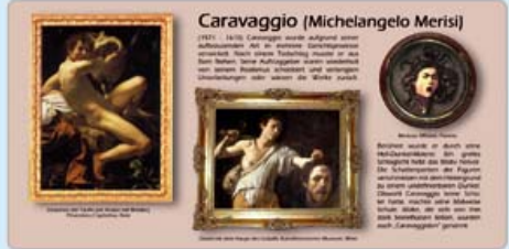
Caravaggio (Michelangelo Merisi) 1571-1610. Caravaggio wurde aufgrund seiner naturalistischen Art in der Malerei, die sich auf die Darstellung von Alltagsszenen beschränkte, als „König der Karavaggisti“ bezeichnet. Er war ein wichtiger Vertreter des Barock in der Malerei.