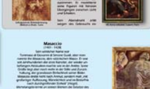
Masaccio 1401-1428. Masaccio war ein wichtiger Vertreter des Barock in der Malerei. Er war ein wichtiger Vertreter des Barock in der Malerei.