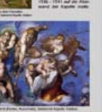
Leonardo da Vinci 1452-1519. Leonardo da Vinci war ein wichtiger Vertreter des Barock in der Malerei. Er war ein wichtiger Vertreter des Barock in der Malerei.