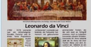
Leonardo da Vinci 1452-1519. Leonardo da Vinci war ein wichtiger Vertreter des Barock in der Malerei. Er war ein wichtiger Vertreter des Barock in der Malerei.