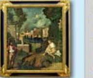
Giorgione 1478-1510. Giorgione war ein wichtiger Vertreter des Barock in der Malerei. Er war ein wichtiger Vertreter des Barock in der Malerei.