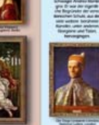
Giovanni Bellini 1430-1516. Bellini war ein wichtiger Vertreter des Barock in der Malerei. Er war ein wichtiger Vertreter des Barock in der Malerei.