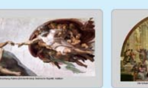
Raffaello 1483-1520. Raffaello war ein wichtiger Vertreter des Barock in der Malerei. Er war ein wichtiger Vertreter des Barock in der Malerei.