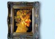
Giacopo Arcimboldo 1527-1593. Arcimboldo war ein wichtiger Vertreter des Barock in der Malerei. Er war ein wichtiger Vertreter des Barock in der Malerei.