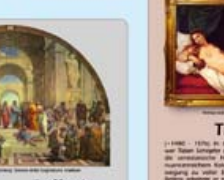
Raffaello 1483-1520. Raffaello war ein wichtiger Vertreter des Barock in der Malerei. Er war ein wichtiger Vertreter des Barock in der Malerei.