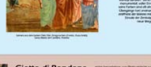
Giotto di Bondone 1267-1336. Giotto di Bondone war ein wichtiger Vertreter des Barock in der Malerei. Er war ein wichtiger Vertreter des Barock in der Malerei.