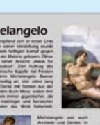
Michelangelo 1475-1564. Michelangelo war ein wichtiger Vertreter des Barock in der Malerei. Er war ein wichtiger Vertreter des Barock in der Malerei.