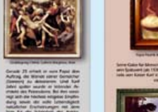
Raffaello 1483-1520. Raffaello war ein wichtiger Vertreter des Barock in der Malerei. Er war ein wichtiger Vertreter des Barock in der Malerei.