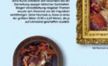
Paolo Veronese (Paolo Cali) 1528-1588. Veronese war ein wichtiger Vertreter des Barock in der Malerei. Er war ein wichtiger Vertreter des Barock in der Malerei.