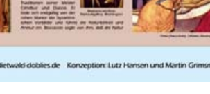
Giotto di Bondone 1267-1336. Giotto di Bondone war ein wichtiger Vertreter des Barock in der Malerei. Er war ein wichtiger Vertreter des Barock in der Malerei.