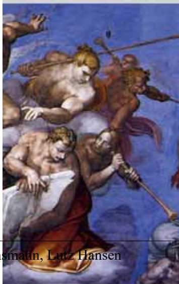
, Sixtinische Kapelle, Vatikan

Michelangelo war auch Architekt und Dichter. In einem seiner Gedichte gestand er von seinem Werk: „Es wurde immer zu einem Bild meiner eigenen Verstörtheit und trug das finstere Zeichen, das ich selbst auf der Stirn trage.“ Einen Höhepunkt seines malerischen Schaffens stellt das Jüngste Gericht – eine riesige Komposition mit fast 400 Figuren – dar, das er 1536 - 1541 auf die Altarwand der Kapelle malte.