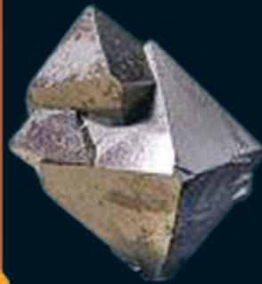
Magnetit \text{Fe}_3\text{O}_4 (Magnet Eisenstein)

Verbindungen von Metallen oder H oder Sauerstoff-Wasserst